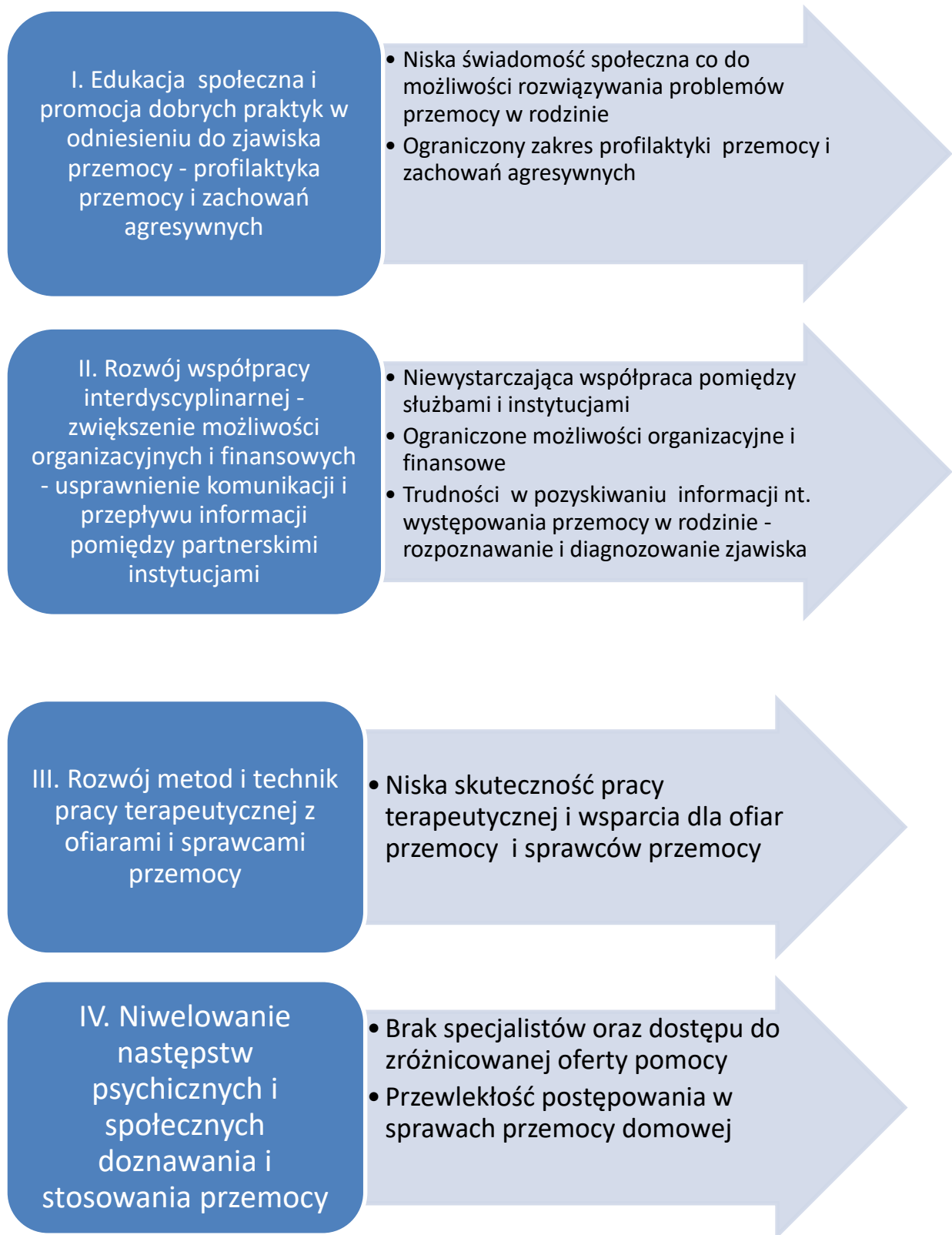
rys. 1 Kierunki działania i odpowiadające im obszary problemowe