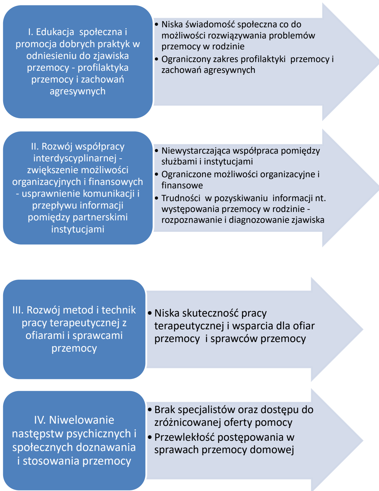
rys. 1 Kierunki działania i odpowiadające im obszary problemowe