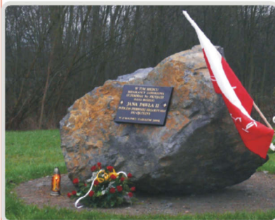
Zabierzów - pamiątkowy kamień

Niewątpliwie najważniejszym z miejsc związanych z Ojcem Świętym- św. Janem Pawłem II jest Międzynarodowy Port Lotniczy Kraków-Balice (dziś Kraków Airport), noszący, nie bez przyczyny, Jego imię. Wszak tu w Balicach, żegnaliśmy