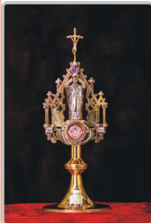
Zabierzów - relikwiarz z kropłą krwi św. Jana Pawła II