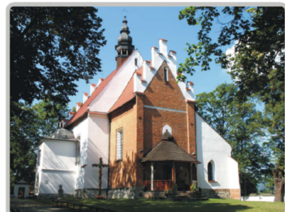
Rudawa - kościół

Kolejną wizytę kanoniczną na terenie gminy Zabierzów kard. Karol Wojtyła odbył w okresie 30 IV - 2 V 1977 r. nawiedzając parafię w Morawicy, do której należały wówczas Aleksandrowice, Balice, Brzoskwinia, Burów, Kleszczów oraz Szczyglice. We wszystkich tych miejscowościach 1 V spotykał się z mieszkańcami, zaś w Szczyglicach, w tamtejszej kaplicy odprawił Mszę św., o czym przypomina umieszczona na jej ścianie, a ufundowana przez mieszkańców, pamiątkowa tablica. Kilkakrotnie kard. Karol Wojtyła bawił w Rudawie. Po raz pierwszy 15 V 1963 r., jeszcze jako arcybiskup, wizytując parafię, następnie 9 VI 1970 r. i 26 X 1976 r. na zjazdach koleżeńskich księży oraz 1 XI 1970 r. wygłaszając homilię z okazji rozpoczęcia nowenny w 900-lecie parafii. W lipcu 1972 r. odwiedził Zabierzów dokonując poświęcenia przebudowanej fasady tutejszego kościoła parafialnego oraz kaplicy cmentarnej, zaś w 1976 r. w Rząsce podczas wizytacji parafii w Mydlnikach, której wówczas podlegała miejscowa kaplica, udzielił sakramentów bierzmowania.