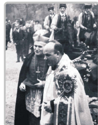
W Zelkowie - 1972 r.