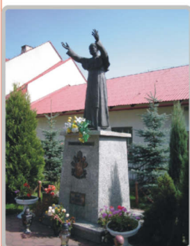
Zelków - papieski pomnik

Kolejną wizytę kanoniczną na terenie gminy Zabierzów kard. Karol Wojtyła odbył w okresie 30 IV - 2 V 1977 r. nawiedzając parafię w Morawicy, do której należały wówczas Aleksandrowice, Balice, Brzoskwinia, Burów, Kleszczów oraz Szczyglice. We wszystkich tych miejscowościach 1 V spotykał się z mieszkańcami, zaś w Szczyglicach, w tamtejszej kaplicy odprawił Mszę św., o czym przypomina umieszczona na jej ścianie, a ufundowana przez mieszkańców, pamiątkowa tablica. Kilkakrotnie kard. Karol Wojtyła bawił w Rudawie. Po raz pierwszy 15 V 1963 r., jeszcze jako arcybiskup, wizytując parafię, następnie 9 VI 1970 r. i 26 X 1976 r. na zjazdach koleżeńskich księży oraz 1 XI 1970 r. wygłaszając homilię z okazji rozpoczęcia nowenny w 900-lecie parafii. W lipcu 1972 r. odwiedził Zabierzów dokonując poświęcenia przebudowanej fasady tutejszego kościoła parafialnego oraz kaplicy cmentarnej, zaś w 1976 r. w Rząsce podczas wizytacji parafii w Mydlnikach, której wówczas podlegała miejscowa kaplica, udzielił sakramentów bierzmowania.